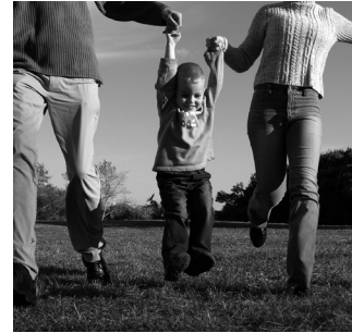
Fig.2 Acciones positivas frente a acciones negativas (Loizaga 2011)