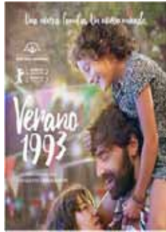
Simón, C. (2017) Verano 1993 España, 97 min