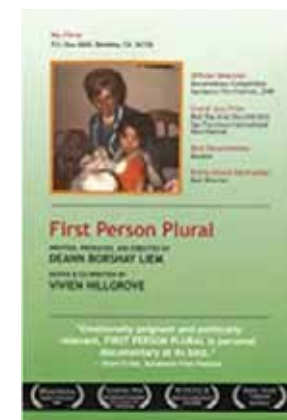
Borshay, D. (2000) First Person Plural Estados Unidos, 60 min

Basada en la autobiografía de Saroo Brierley , A Long Way Home , publicada en 2013. Saroo con tan solo cinco años se extravía en un tren y, cuando llega a Calcuta, le resulta imposible comunicarse por no hablar el bengalí. Tras un largo viaje acaba siendo adoptado por una pareja australiana, quienes lo llevan a vivir a Hobart (Australia). Veinticinco años después con la única ayuda de la aplicación Google Earth intenta encontrar a su familia biológica.