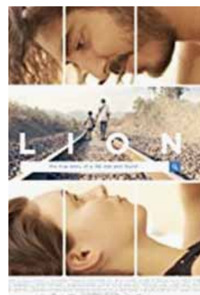
Davies, G. (2016) Lion Australia, 120 min

Basada en la autobiografía de Saroo Brierley , A Long Way Home , publicada en 2013. Saroo con tan solo cinco años se extravía en un tren y, cuando llega a Calcuta, le resulta imposible comunicarse por no hablar el bengalí. Tras un largo viaje acaba siendo adoptado por una pareja australiana, quienes lo llevan a vivir a Hobart (Australia). Veinticinco años después con la única ayuda de la aplicación Google Earth intenta encontrar a su familia biológica.