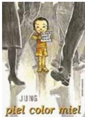
Jung, S. J. (2007) Piel Color Miel Editorial Rossell