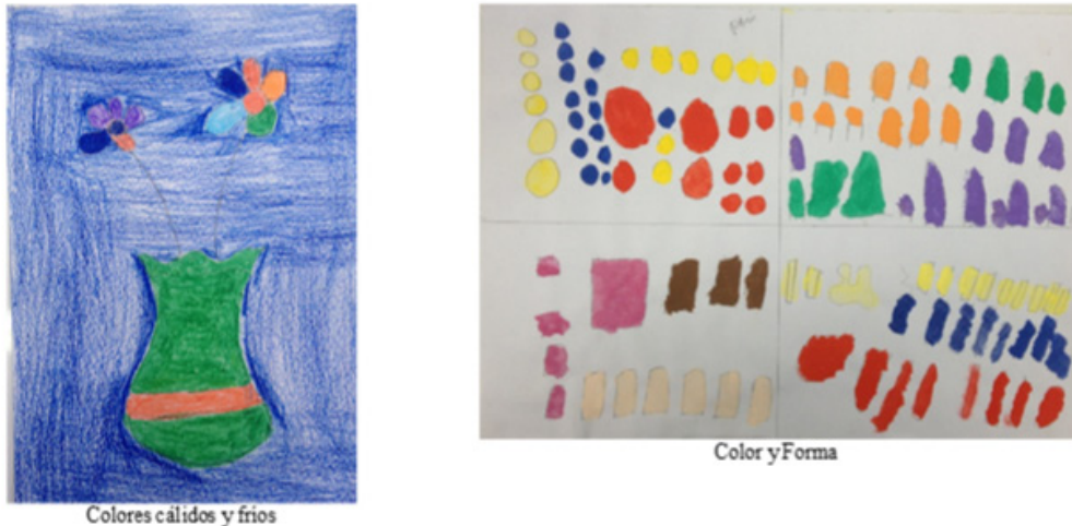
Figura 2. Propuestas visuales de Juan a partir del desarrollo de la 1ª etapa.

Para apoyar los procesos creativos del alumno, en períodos de tiempos programados, se esbozaba en el papel alguna representación de formas figurativas o abstractas (ver fig. 2) con el sólo propósito de estimular la motivación hacia la utilización de diversos colores.