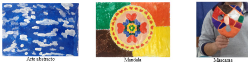
Figura 4. Propuestas visuales de Juan a partir de las sesiones correspondientes a la 3ª etapa.

En la confección de la máscara, Juan propuso su rostro para la obtención del molde. Luego lo pintó utilizando colores cálidos y fríos sobre la base de figuras geométricas. Esta decisión, creemos como resultado, refuerza una condición afectiva y de autoestima, que contribuye de manera significativa a la necesidad de valoración de sí mismo, respeto por la propia creación y estima hacia el logro de su propio aprendizaje artístico (ver fig. 4).