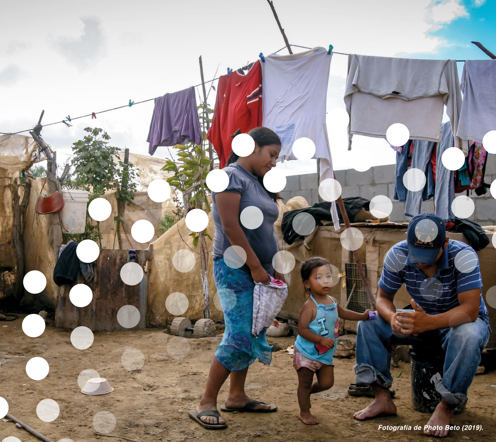
Fotografía de Photo Beto (2019).