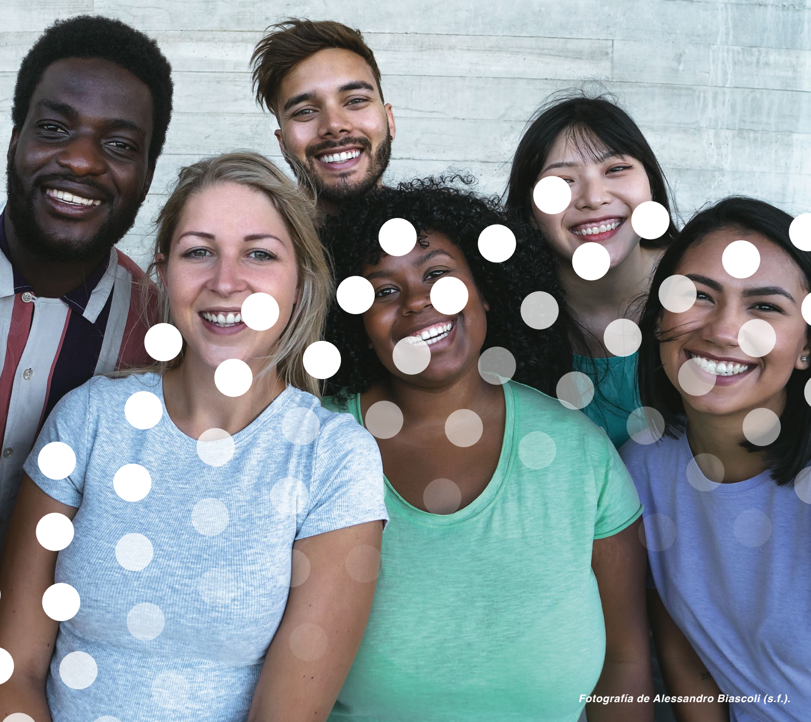
Fotografía de Alessandro Biascoli (s.f.).