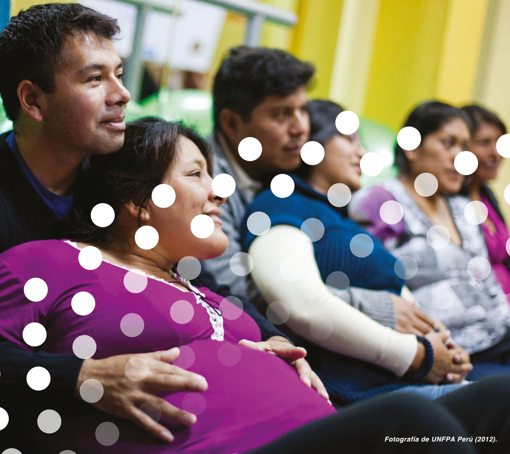
Fotografía de UNFPA Perú (2012).